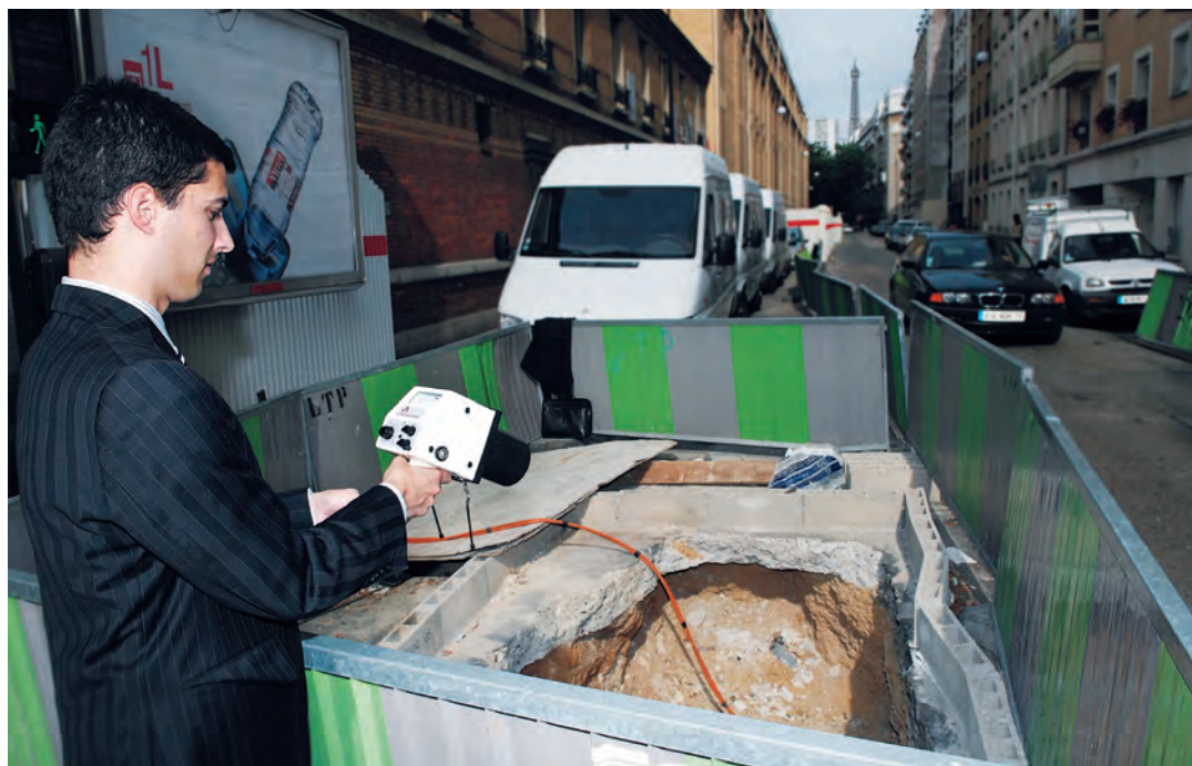
Mesure du débit de dose avant un tir de gammagraphie