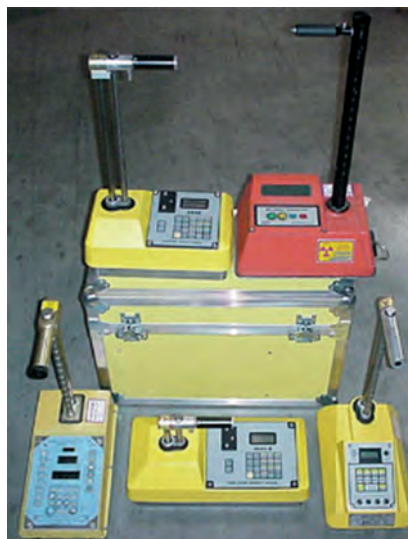
Plusieurs modèles de gammadensimètres

En 2006, l'ASN a poursuivi ses actions destinées à favoriser le traitement des autorisations par ses divisions régionales. Ainsi, l'ASN confie progressivement aux Divisions de la sûreté nucléaire et de la radioprotection l'instruction de certaines autorisations, par exemple celles relatives à la détention et l'utilisation de gammagraphes, de gammadensimètres ou d'appareils de détection de plomb dans les peintures.