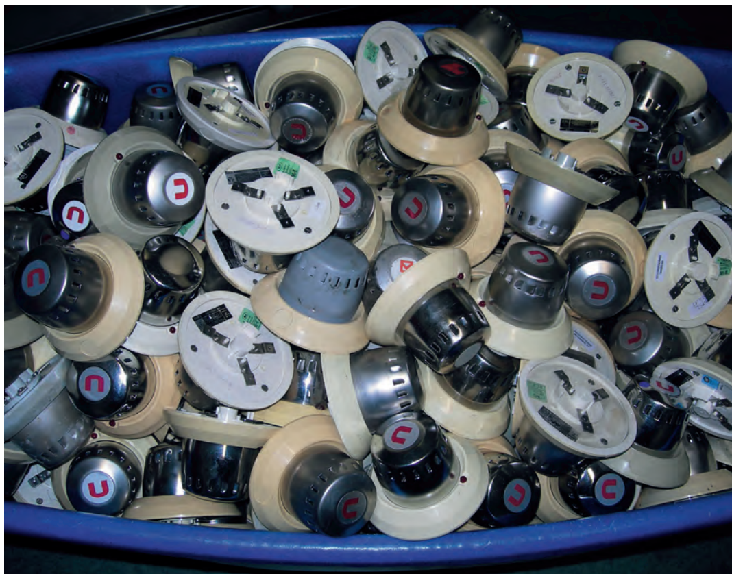
Détecteurs en phase de pré-démantèlement de la source d'americium

Diverses activités tendent à disparaître du fait notamment de l'évolution des techniques : c'est le cas de la détection de fumée (voir encadré). C'est également le cas de la détermination du point de rosée, de la mesure de niveau et de la mesure de densité pour lesquelles les techniques à base de rayons X ou par ultrasons tendent à se substituer à celles employant des radionucléides ou de la mesure de la hauteur d'enneigement ou du positionnement des bennes de remonte-pentes à partir d'une source radioactive fixée dans les épissures du câble porteur.