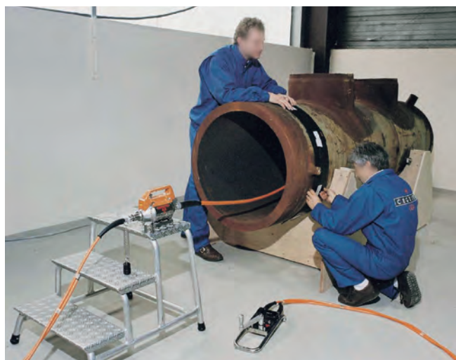
Tir de gammagraphie en préparation

Elle est mise en œuvre pour la stérilisation de dispositifs médicaux, de produits pharmaceutiques ou cosmétiques et la conservation de produits alimentaires.