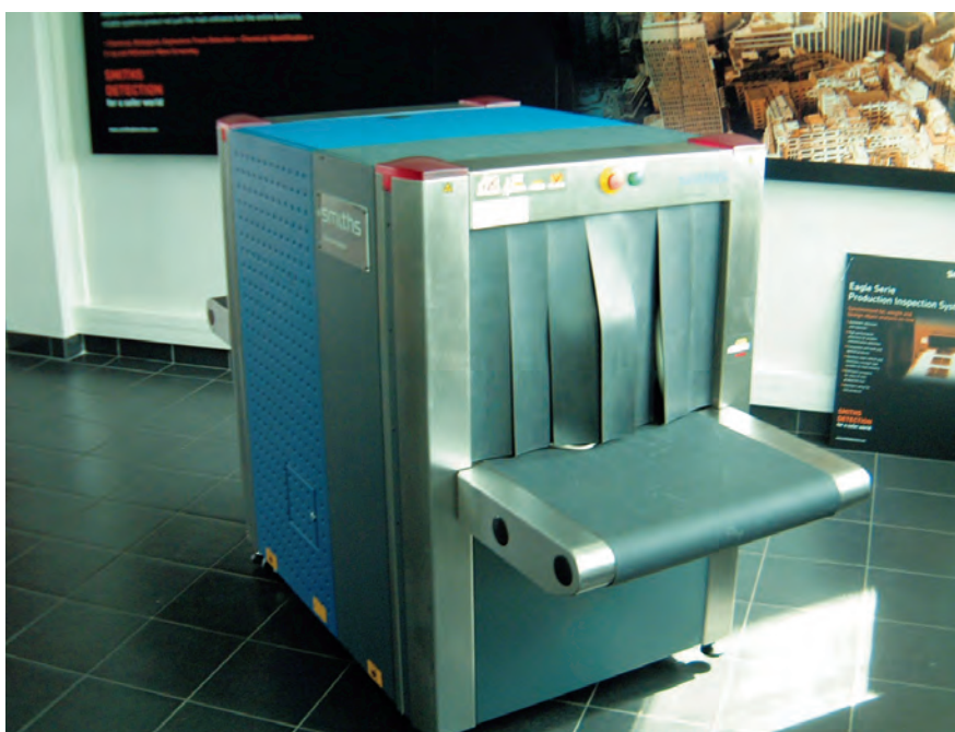
Contrôleur de bagages

Les vétérinaires utilisent également ces appareils dans le cadre usuel de radiographies osseuses et autres diagnostics courants.