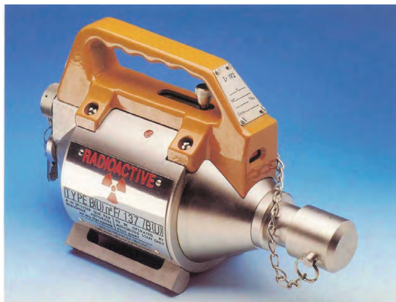
Exemple de gammagraphe – le Gam80