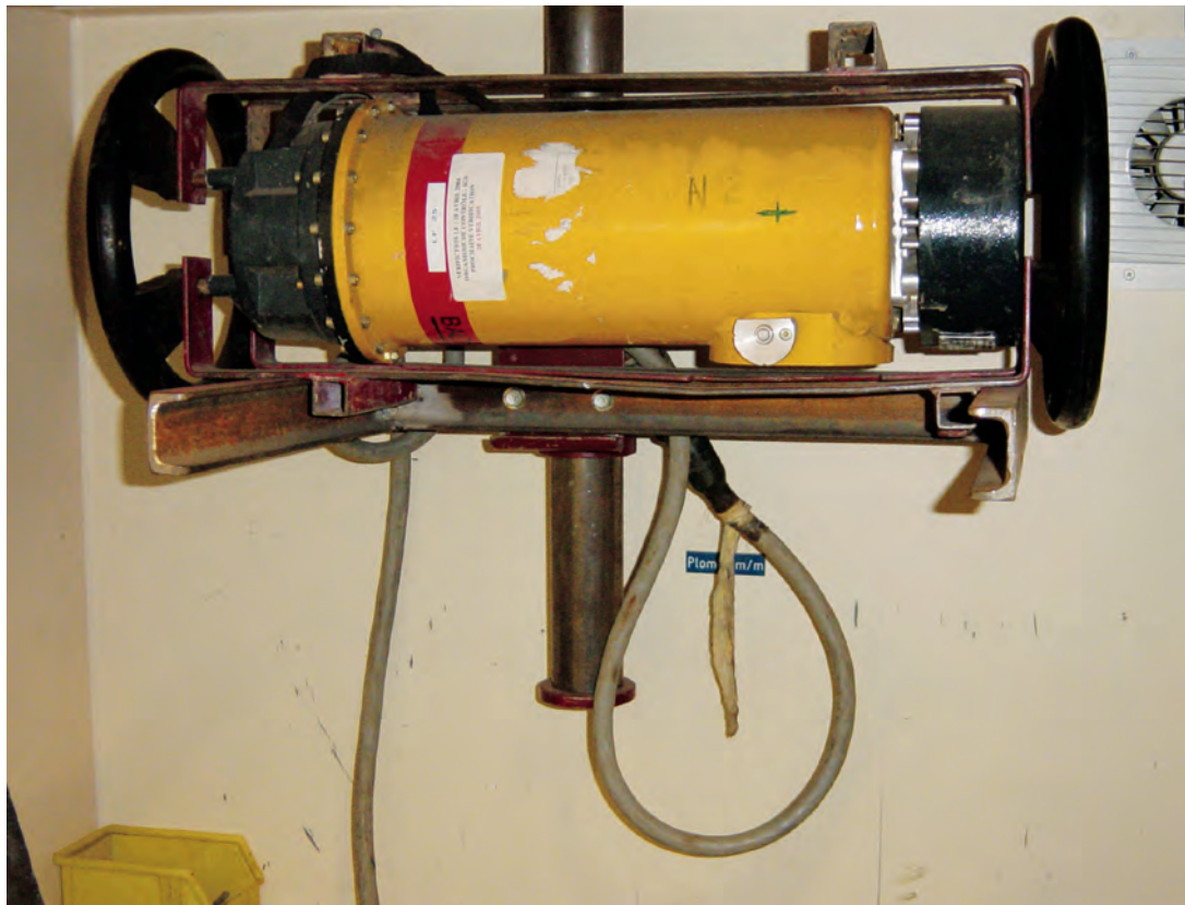
Générateur électrique de rayonnements X dans une enceinte de tir

avec l'évolution de la réglementation, qui a modifié les limites annuelles d'exposition des travailleurs et du public et fait passer ces appareils du régime de déclaration au régime d'autorisation.